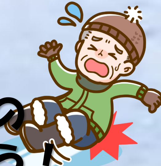
氷転倒による搬送者数（11月から1月）

今年度、 氷転倒 による救急搬送は 過去 最多 を更新しています！ 例年 2月・3月 は特に凍結路面での 転倒が増えますので注意しましょう！